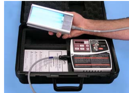
El equipo se puede operar desde su robusto estuche de transporte

Diferente a otros equipos de mano que usan una sola lámpara de 9-watios, el SolRx Serie 100 se equipa con dos lámparas de 9-watios para tener doble potencia de entrada, doble área de tratamiento, y una forma del área de tratamiento más útil (más cuadrada).