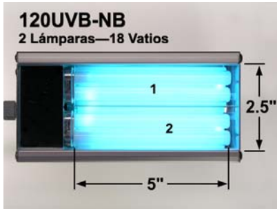
120UVB-NB 2 Lámparas—18 Vatios