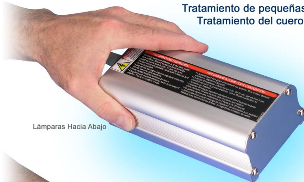
Lámparas Hacia Abajo

Tratamiento de pequeñas manchas Tratamiento del cuero cabelludo