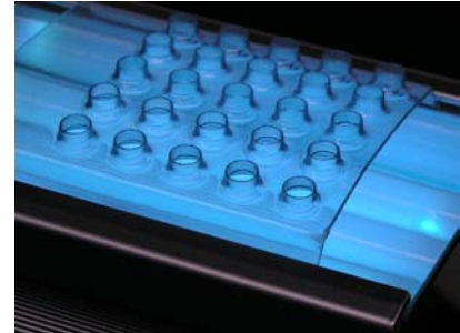
El cepillo Light Brush™ opcional separa el cabello, la luz UV llega al cuero cabelludo