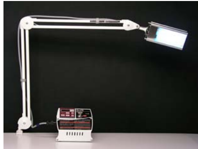
El brazo de posición opcional permite el uso manos-libres (muestra en escritorio)