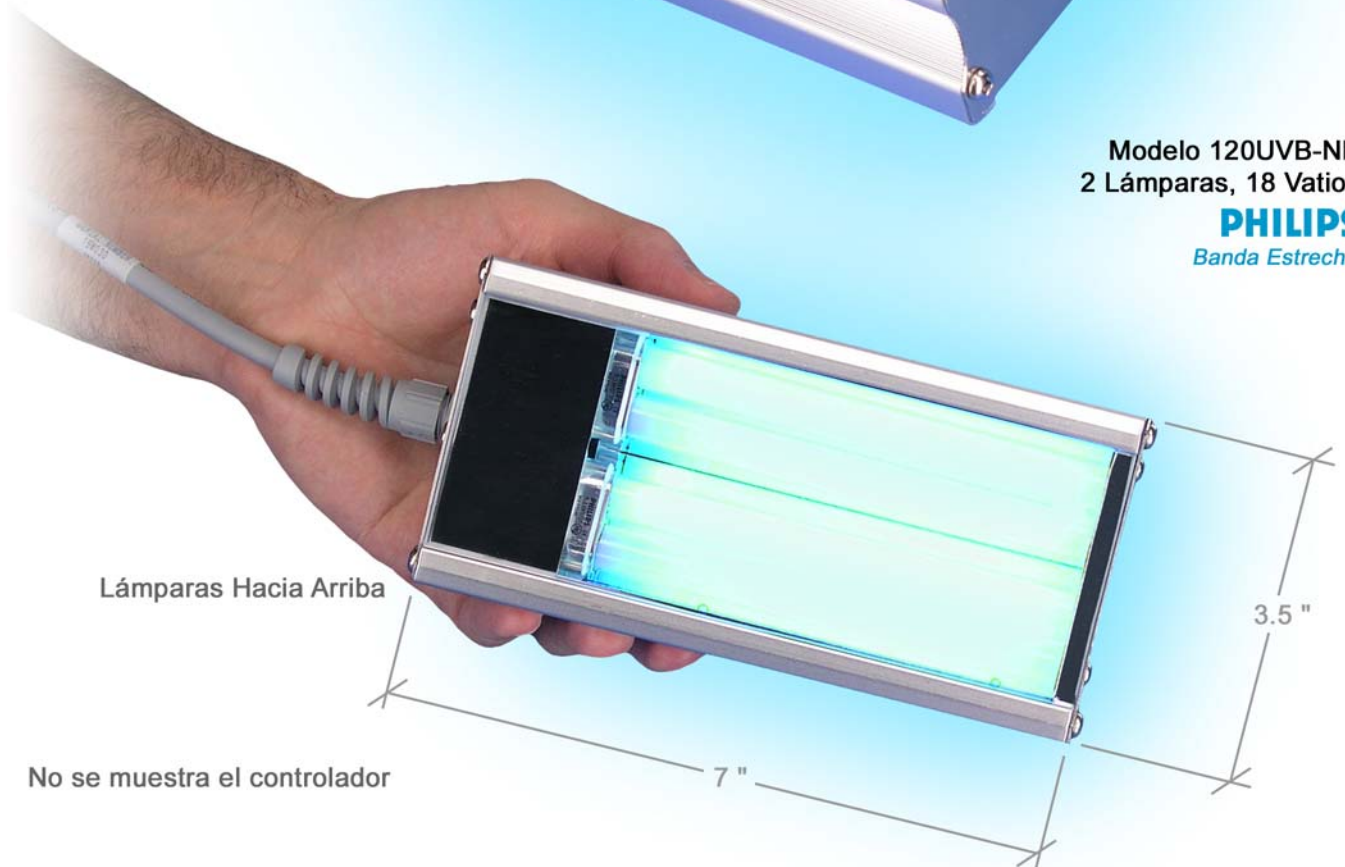
Lámparas Hacia Arriba