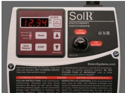
El temporizador digital e interruptor son importantes características de seguridad