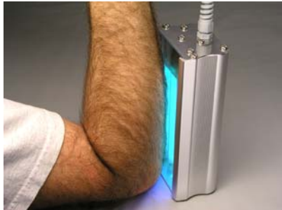
Una de las muchas formas diferente de colocar la barra en una superficie.