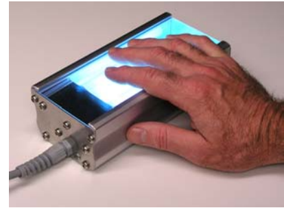
El cuerpo de aluminio ligero ayuda a mantener el equipo fresco.